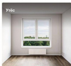
2-комнатная квартира, 47,5 м 2 Корпус 3, 6 этаж

Высота потолков 2,66 м Жилая площадь 21,5 м 2 Отделка White box Особенности Готовая отделка