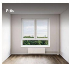
2-комнатная квартира, 47,5 м 2 Корпус 3, 6 этаж

Высота потолков 2,66 м Жилая площадь 21,5 м 2 Отделка White box Особенности Готовая отделка