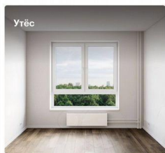
2-комнатная квартира, 47,5 м 2 Корпус 3, 6 этаж

Высота потолков 2,66 м Жилая площадь 21,5 м 2 Отделка White box Особенности Готовая отделка